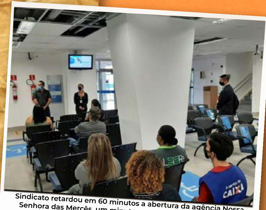
Sindicato retardou em 60 minutos a abertura da agência Nossa Senhora das Mercês, um minuto para cada empregado Caixa falecido no país (6 de maio)