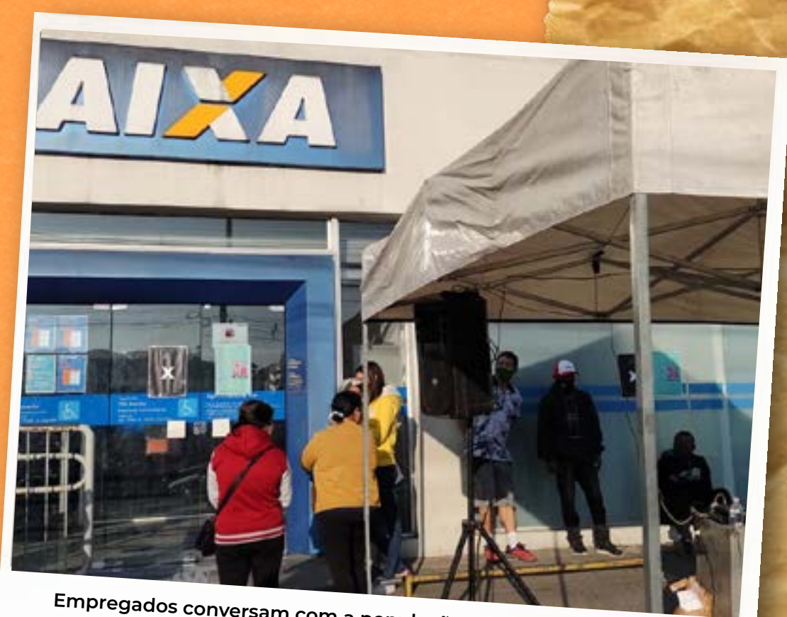
Empregados conversam com a população em ato de homenagem aos trabalhadores mortos na pandemia (19 de maio)