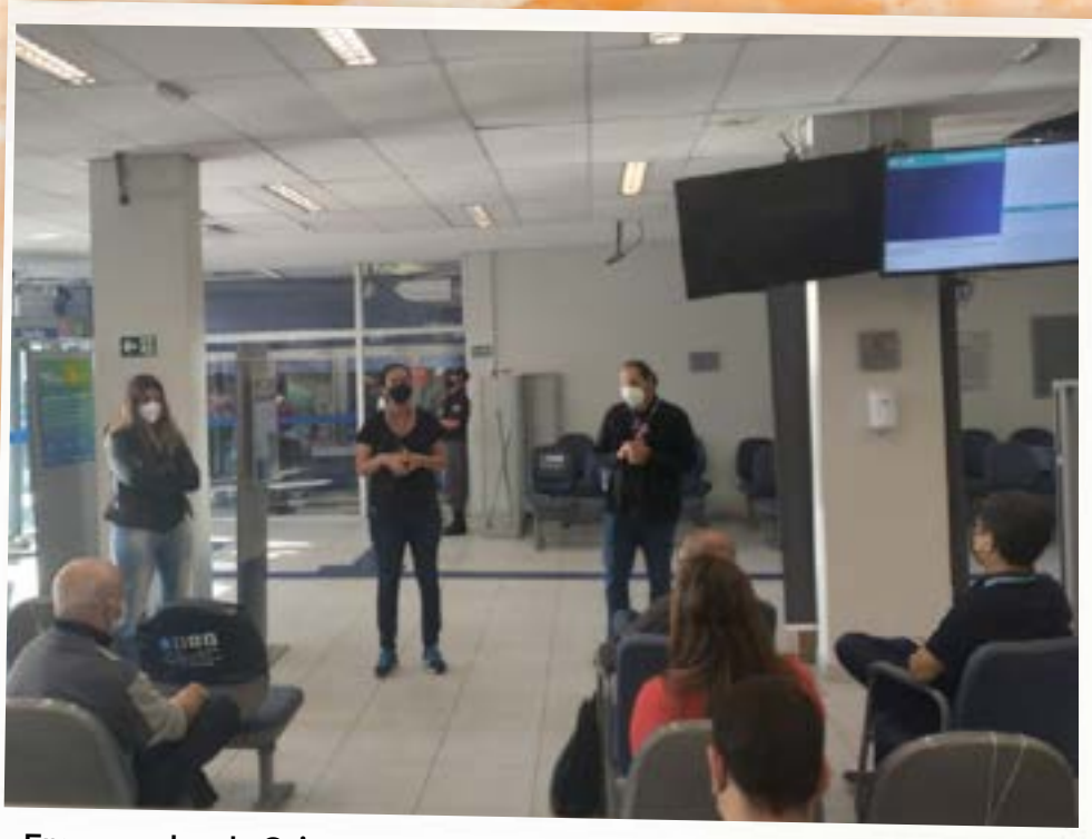
Empregados da Caixa em Estado de greve fazem retardo da abertura da Agência Vila Joaniza e homenagem aos mortos na Pandemia (19 de maio)

Do luto à luta. Este foi o principal mote dos protestos de empregados da Caixa por todo o país, que marcaram o mês de maio, em homenagem às quase 500 mil vítimas de Covid-19, entre eles trabalhadores do banco público, que também são vítimas da condução desastrosa da crise sanitária pelo governo Bolsonaro.