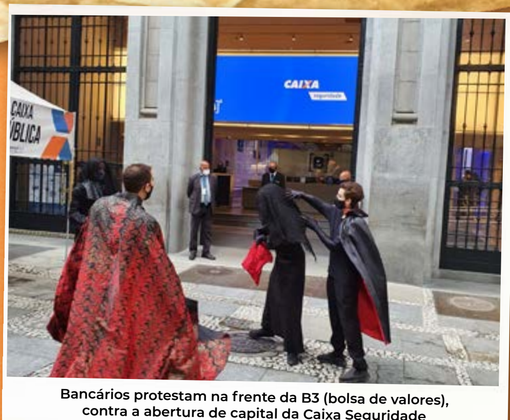
Bancários protestam na frente da B3 (bolsa de valores), contra a abertura de capital da Caixa Seguridade