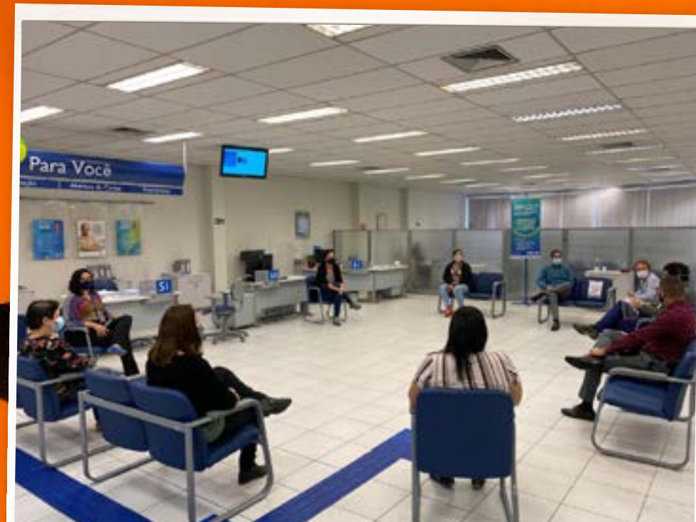
Protesto pela morte de terceirizado na agência Monteiro de Melo (Lapa)