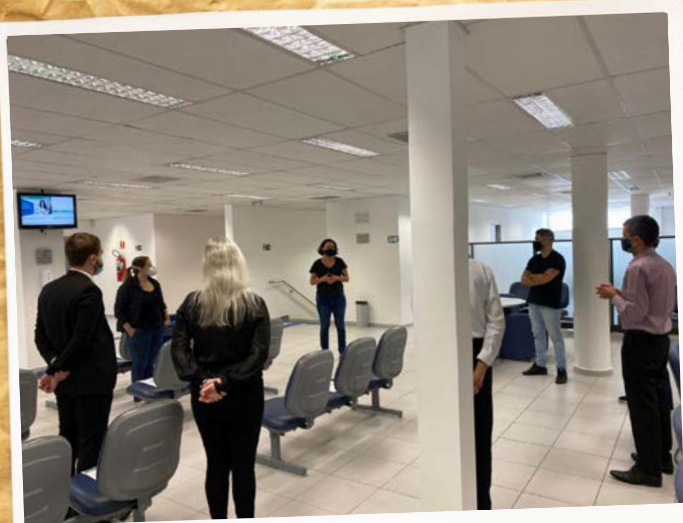
Empregados da Caixa prestam homenagem a uma vigilante que morreu por suspeita de Covid-19 e outras cinco pessoas foram contaminadas (6 de maio)