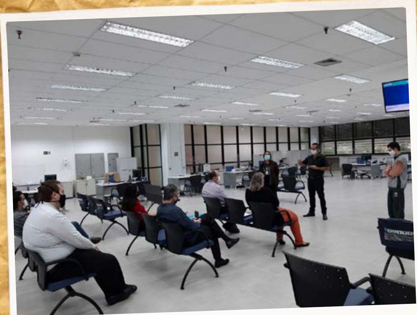
Empregados da Caixa em luto pelos colegas que faleceram vítimas de covid-19 (11 de maio)