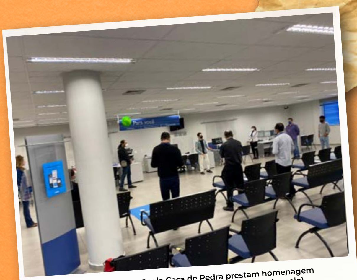
Empregados da agência Casa de Pedra prestam homenagem aos colegas que sucumbiram ao coronavírus (7 de maio)