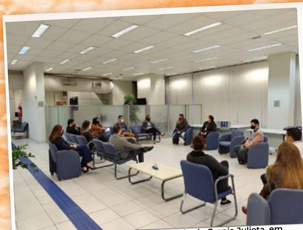
Paralisação de 63 minutos, na agência Granja Julieta, em manifestação de luto pelo número de empregados da Caixa que morreram em decorrência da Covid19 (14 de maio)